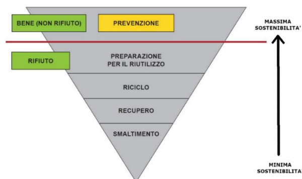
Fig. 1 gerarchia della gestione dei rifiuti (art. 179 del D.Lgs. 152/2006)

Il D.lgs. 152/2006 “ Testo Unico Ambiente ” alla Parte quarta - Norme in materia di gestione dei rifiuti e di bonifica dei siti inquinati - all’ art. 179 “ Criteri di priorità nella gestione dei rifiuti ”, seguendo le indicazioni comunitarie, stabilisce che la gestione dei rifiuti debba avvenire nel rispetto della seguente gerarchia (fig.1): 1) PREVENZIONE 2) PREPARAZIONE PER IL RIUTILIZZO 3) RICICLO 4) RECUPERO 5) SMALTIMENTO.