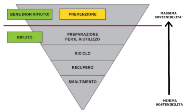
Fig. 1 gerarchia della gestione dei rifiuti (art. 179 del D.Lgs. 152/2006)

Il D.lgs. 152/2006 “ Testo Unico Ambiente ” alla Parte quarta - Norme in materia di gestione dei rifiuti e di bonifica dei siti inquinati - all’ art. 179 “ Criteri di priorità nella gestione dei rifiuti ”, seguendo le indicazioni comunitarie, stabilisce che la gestione dei rifiuti debba avvenire nel rispetto della seguente gerarchia (fig.1): 1) PREVENZIONE 2) PREPARAZIONE PER IL RIUTILIZZO 3) RICICLO 4) RECUPERO 5) SMALTIMENTO.